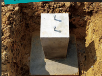
基礎石からより重量がある現場打ち 独立基礎へ