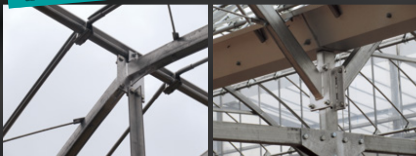
躯体は補強材等を入れ強固に組みあげます