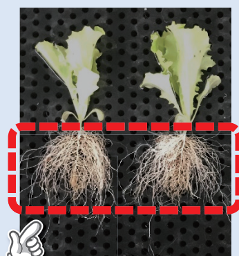
Type Z N150