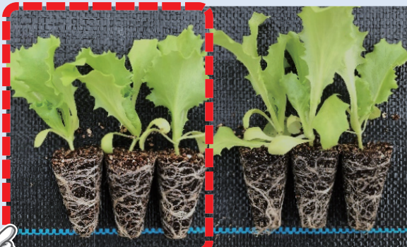
Type Z N150