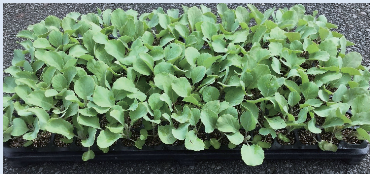
Type Z N150;キャベツ(おきな) 播種後21日目