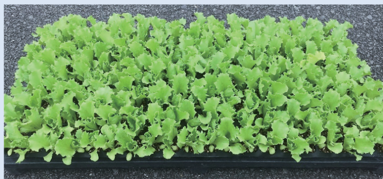
Type Z N150;レタス(サウザー) 播種後21日目