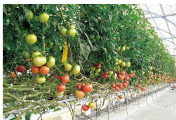
大玉トマトのココバッグ栽培試験

様々な方面から試験依頼をいただき誰が担当しどのように進めていくのかを会議で話し合います。どのお客様に向けた試験なのか目的を明確にした状態で栽培をスタートします。