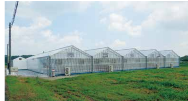
Profarmおよびプロファーム T-キューブは株式会社デンソーの登録商標です。

Profarm T-cubeは、(株)大仙・(株)デンソー・トヨタネの3社で共同開発したセミクローズド(半閉鎖型)ハウスです。天窗を無くし、換気扇を使って外気を取り込むことで、ハウス内の環境ムラを低減し、栽培環境を一層安定化することが可能となります。T-cube専用のProfarm-Controllerとハウス全体をワンパッケージ販売することで、「新しい施設園芸」「日本の農業の競争力向上」「儲かる農業」を提案します。