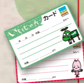
いいじゃんカード