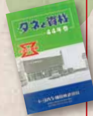
創業当時の カタログ