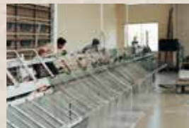
新フィルム加工場