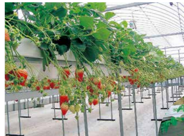
イチゴの高設栽培システム

養液栽培や環境制御などの先端技術の研究開発を続けることで、業界最高レベルの商品の提案・サポートを行っています。お客様の要望に応え、なおかつ作物の栽培に適した栽培システムとなるように設計や提案を行います。栽培システム導入後も常にお客様と作物を育てているという気持ちを持って、専門的な知識と高い技術力でサポートさせていただきます。